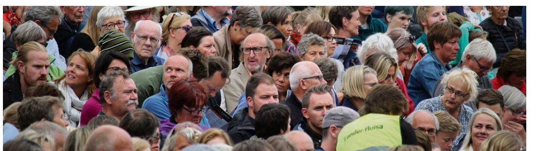
3400 publikummere tok turen til amfiet på Stiklestad for å overvære premieren av Spelet om Heilag Olav.